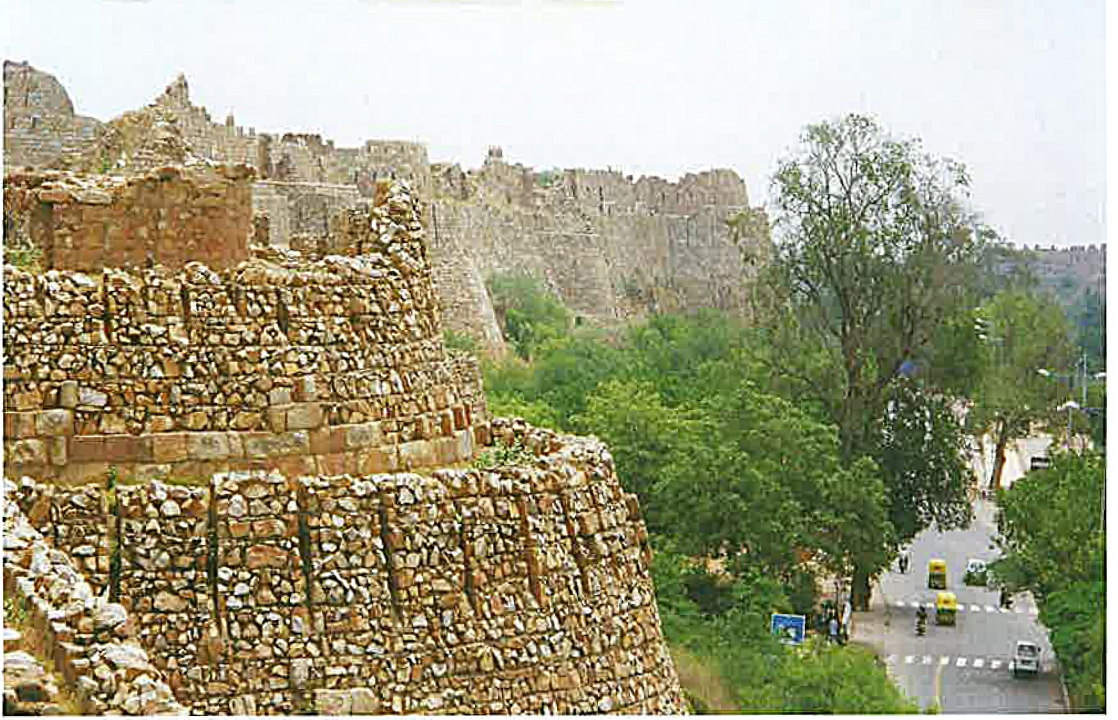
तुगलकाबाद किला, नई दिल्ली