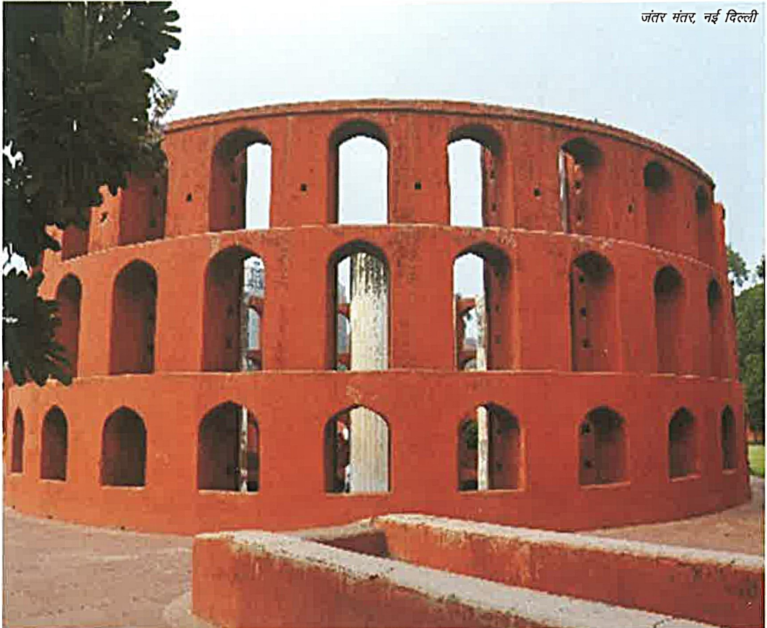
जंतर मंतर, नई दिल्ली

दिल्ली में 1724 में निर्मित जंतर-मंतर, जयपुर के महाराजा जय सिंह द्वितीय द्वारा निर्मित कराई गई अनेक असाधारण खगोलीय वेध-शालाओं में से एक है। अन्य चार वेध-शालाएं जयपुर, वाराणसी, उज्जैन तथा मथुरा में स्थित हैं।