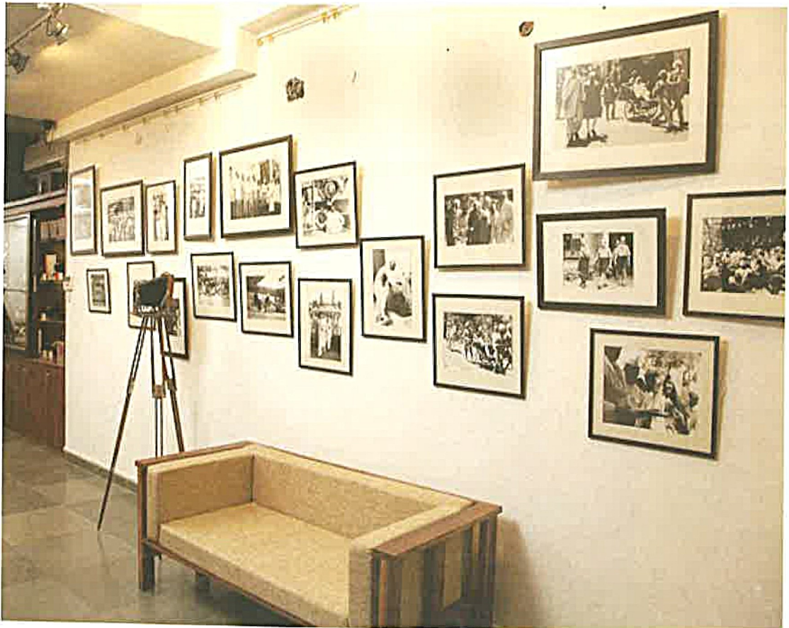
भारत चित्र अभिलेखागार, हरियाणा