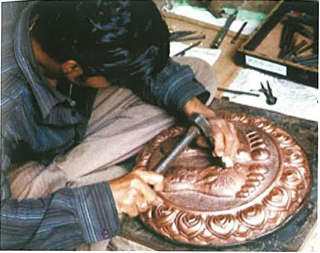
जनाना परवाह, यू.पी.