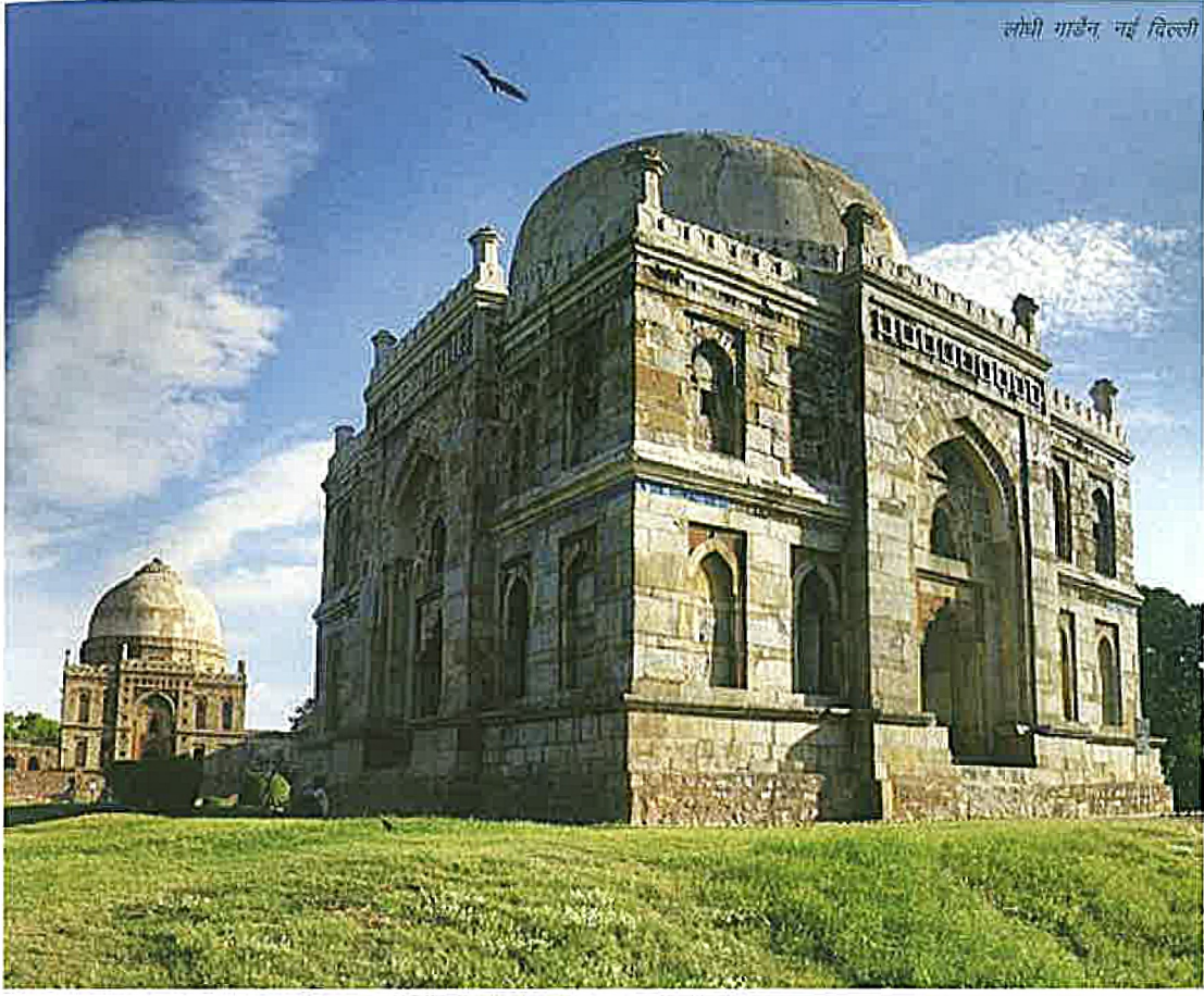
लक्ष्मी गार्डन, नई दिल्ली