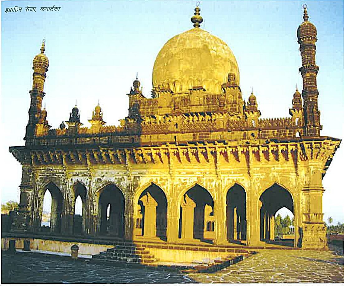
इब्राहिम रौजा, कर्नाटका

सामने आने वाली चुनौतियों की पहचान की जा सके और उनका उपयुक्त समाधान किया जा सके। इसका अनिवार्य उद्देश्य एक ऐसी विधि का विकास करना है जिसे इस क्षेत्र के अन्य बागों के लिए भविष्य में उपयोग में लाया जा सके। संरक्षण प्रयास में वर्तमान बातों का ध्यान रखा जाएगा, अन्य के साथ-साथ ये बातें हैं जैसे कि बाग के उपयोग में परिवर्तन होना (आज यह मकबरा बाग के बजाय सार्वजनिक पार्क अधिक है) या अर्द्ध शुष्क क्षेत्र में पानी की कमी होना या बीजापुर की गर्मी और धूप वाली जलवायु में षेड की सतत आवश्यकता।