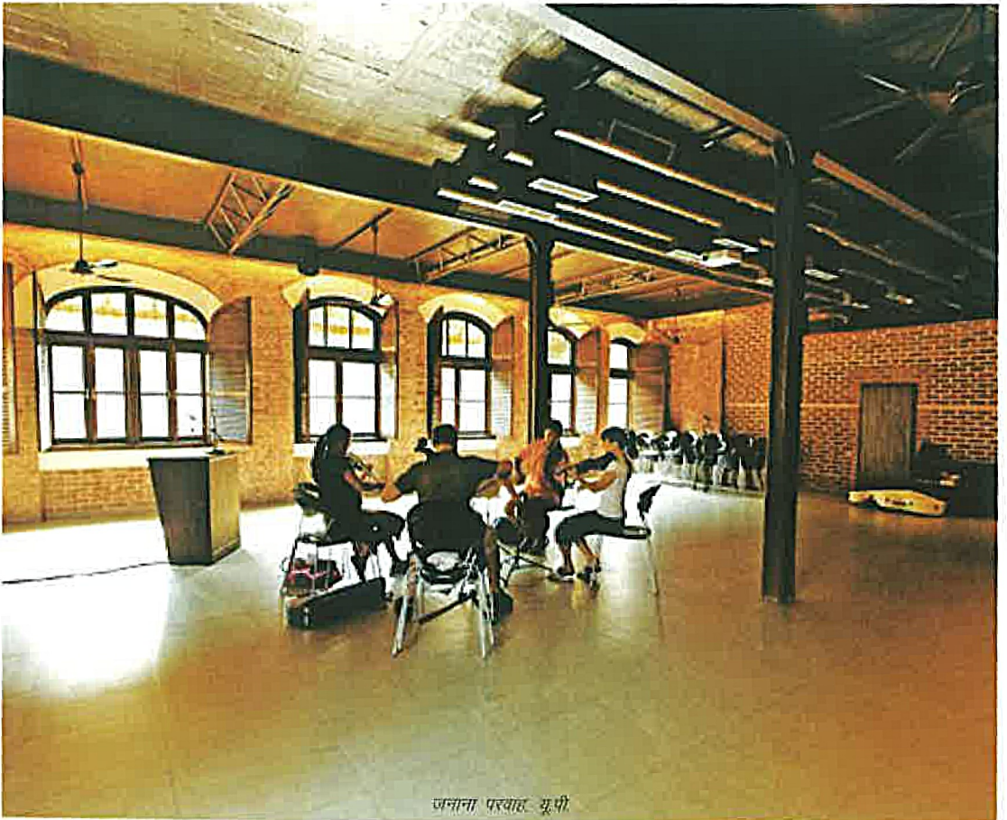
जनाना परवाह, यू.पी.