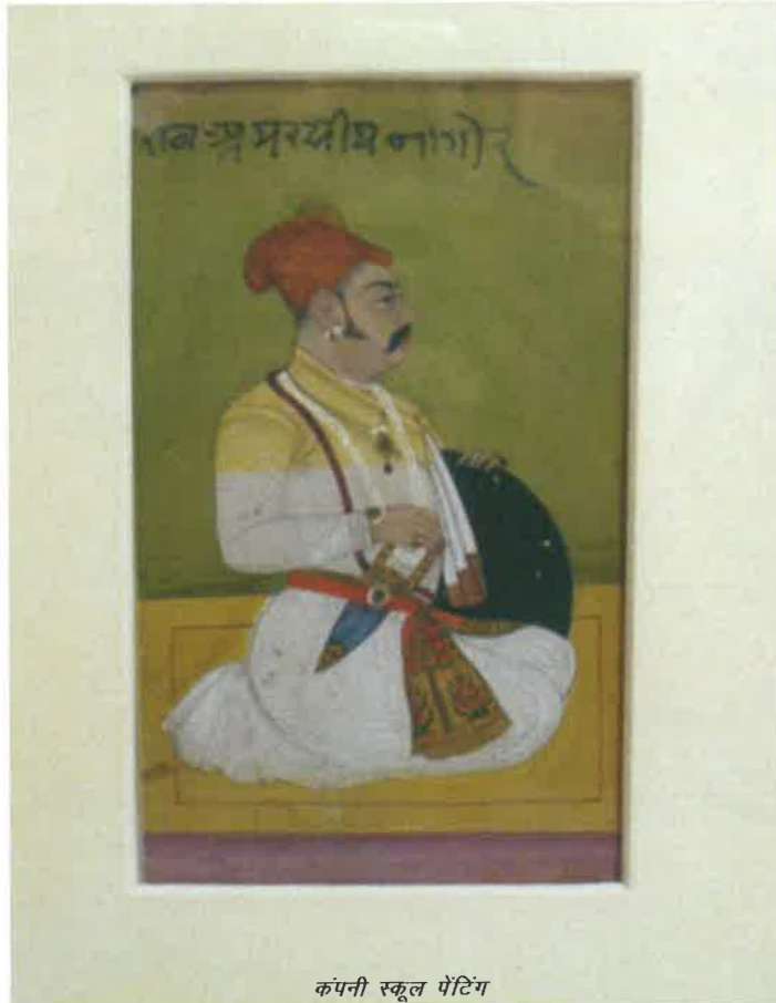
कंपनी स्कूल पेंटिंग

22 मार्च, 2011 – परियोजना को दोबारा चालू करने के लिए जंतर मंतर, नई दिल्ली में परियोजना कार्यान्वयन समिति की एक बैठक आयोजित की गई थी।